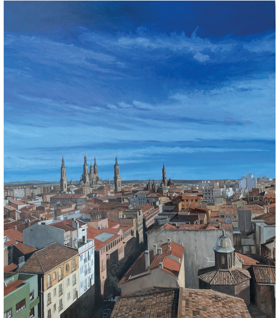
Desde San Pablo